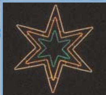
LB Stern 3 klar oder bunt HxB ca. 150 x 130 cm LB auf Anfrage wand/mast/seil 1050021

Lichtbandfarbe Abmessung Ausleuchtung Gewicht Anwendung Art.-Nr.