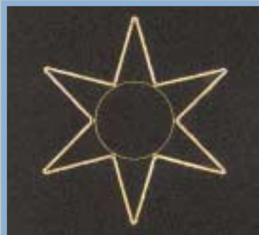
LB Stern 1 klar HxB ca. 135 x 115 cm LB auf Anfrage wand/mast/seil 1050004

Lichtbandfarbe Abmessung Ausleuchtung Gewicht Anwendung Art.-Nr.