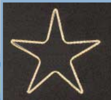
LB Stern 2 klar HxB ca. 75 x 75 cm LB auf Anfrage wand/mast/seil 1050003

Lichtbandfarbe Abmessung Ausleuchtung Gewicht Anwendung Art.-Nr.