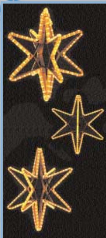
LB Stern 4-6 klar HxB A.ca. 50 x 50 cm oder B.ca. 60 x 60 cm oder C.ca. 70 x 70 cm LB auf Anfrage wand/mast/seil A. 1050016 B. 1050017 C. 1050018

Lichtbandfarbe Abmessung Ausleuchtung Gewicht Anwendung Art.-Nr.